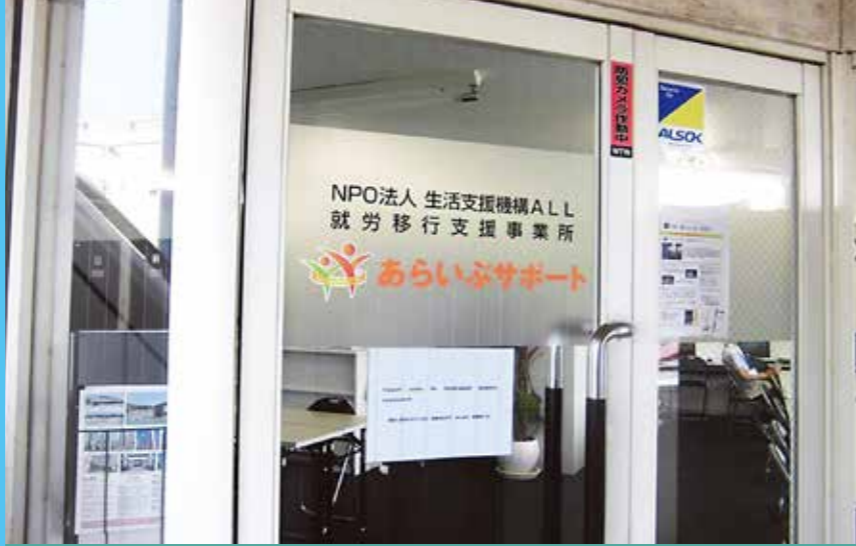
西成区天下茶屋3丁目28番23号 ユーラクビル 6階